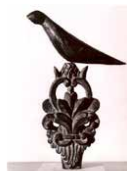
«Κέντρο Ερεύνης της Ελληνικής Λαογραφίας της Ακαδημίας Αθηνών»