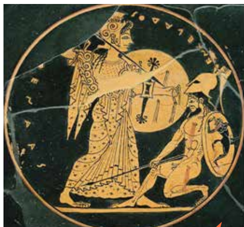
Αθηνά και Εγκέλαδος. Αθηναϊκός δίσκος του 525 π. Χ, Παρίσι, Μουσείο του Λούβρου.

«Μνήσθητι, Κύριε ... Ιδού σεισμός και βροντισμός κι εβάστουσαν ακόμα, που ο κύκλος φθάνει ο φοβερός με τον αφρό στο στόμα κι εσχίσθη αμέσως ...». Διονύσιος Σολωμός, Ελεύθεροι Πολιορκημένοι, Η Έξοδος, Απ. 1.230-231.13