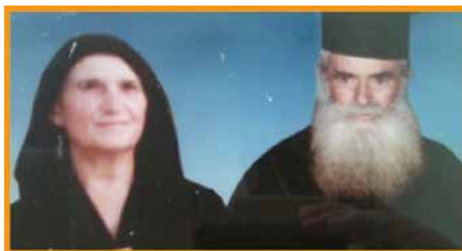
Συνέχεια στη Σελ.6