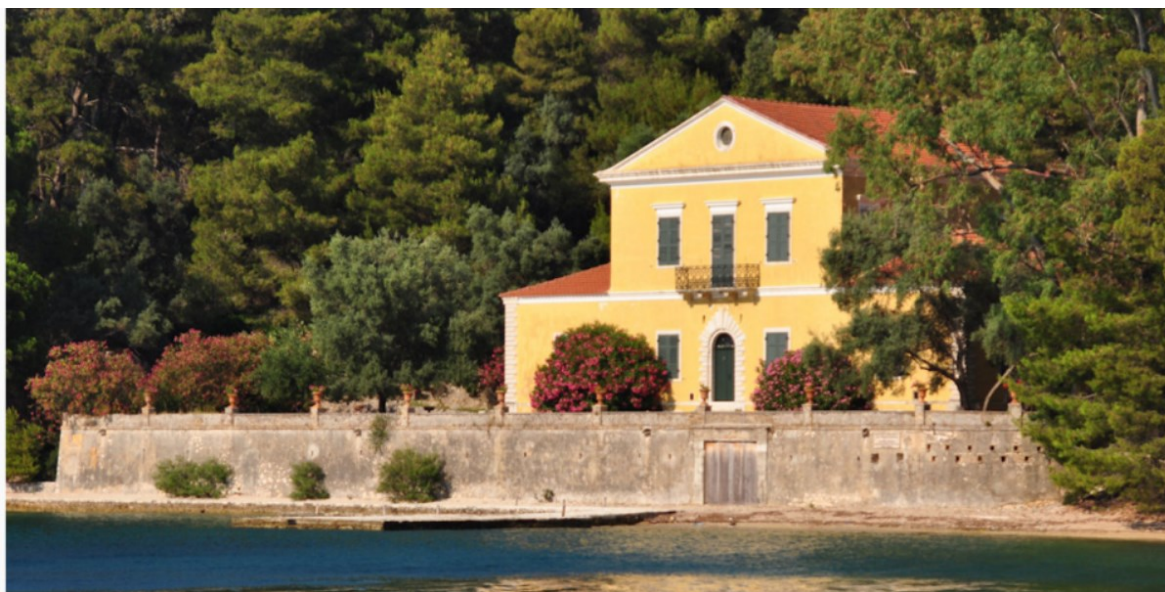
Η Μαδουρή του Αριστοτέλη Βαλαωρίτη

Η Άννα Σκλαβενίτη είναι Δρ. Μεσαιωνικής Ελληνικής Φιλολογίας και Σύμβουλος Εκπαίδευσης νομού Λευκάδας