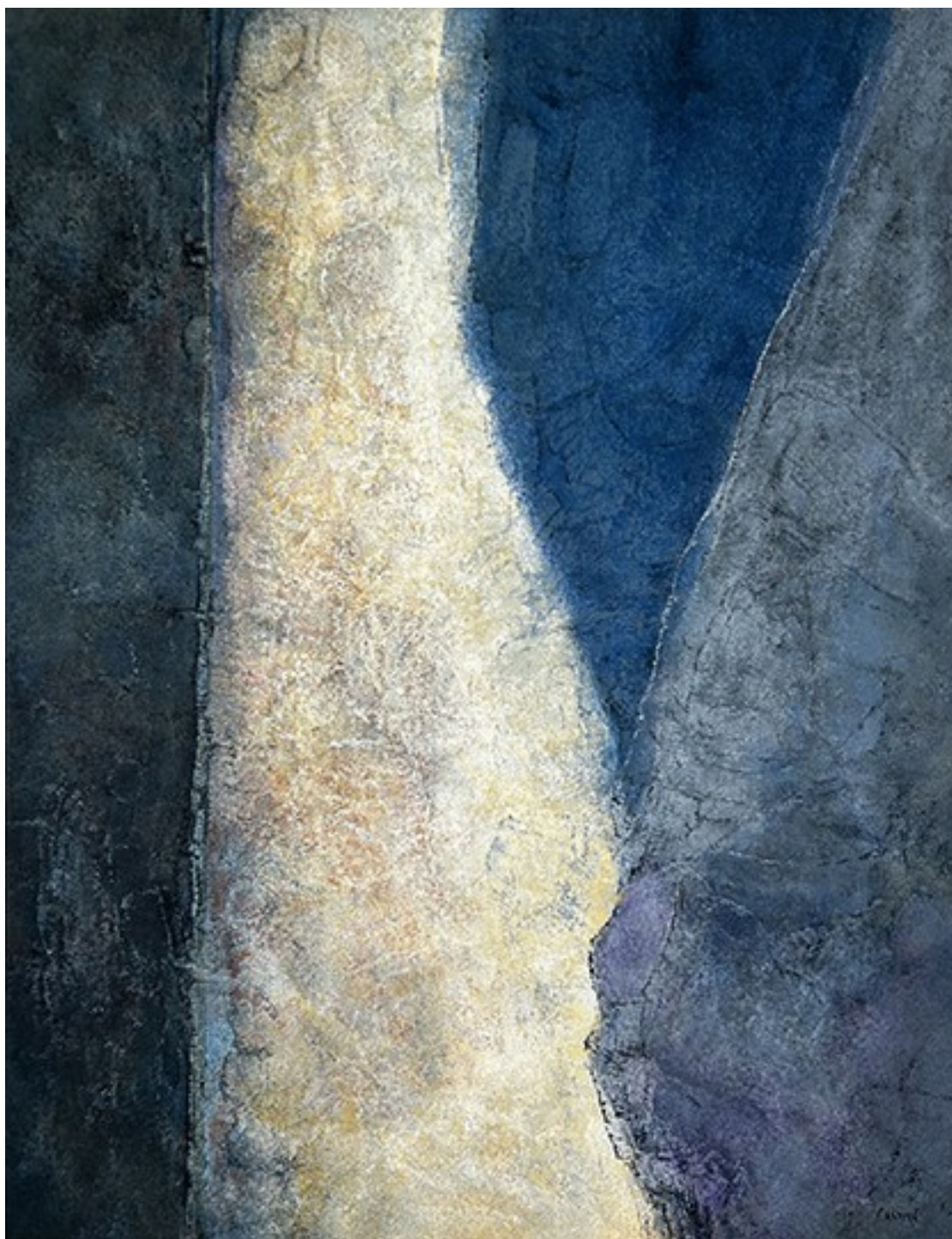
17. Εγκρεμοί , 2022. Ακρυλικό σε καμβά, 83 × 64 εκ.