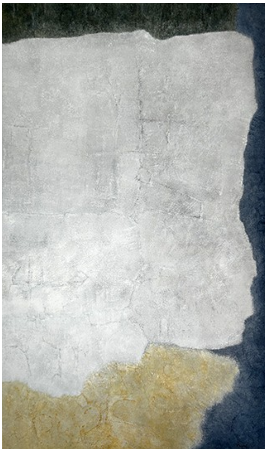
2. Εἰς μνήμην II , 2019. Ακρυλικό σε καμβά, 139 × 83 εκ.