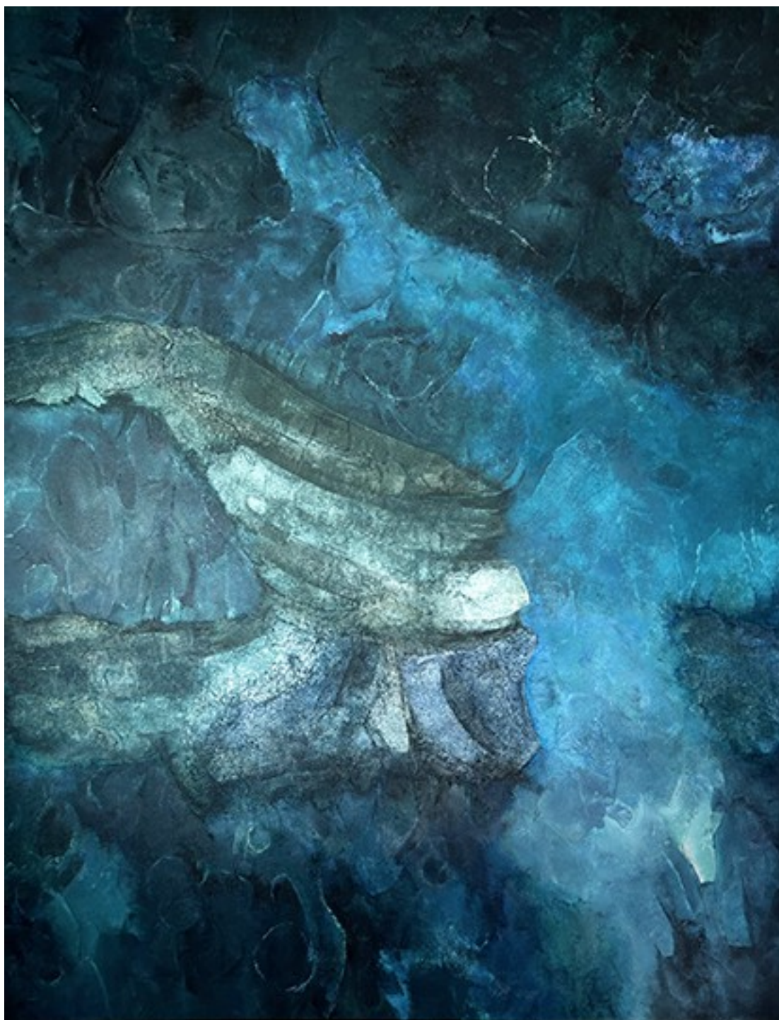
6. Βυθός I , 2021. Ακρυλικό σε καμβά, 162 × 127 εκ.