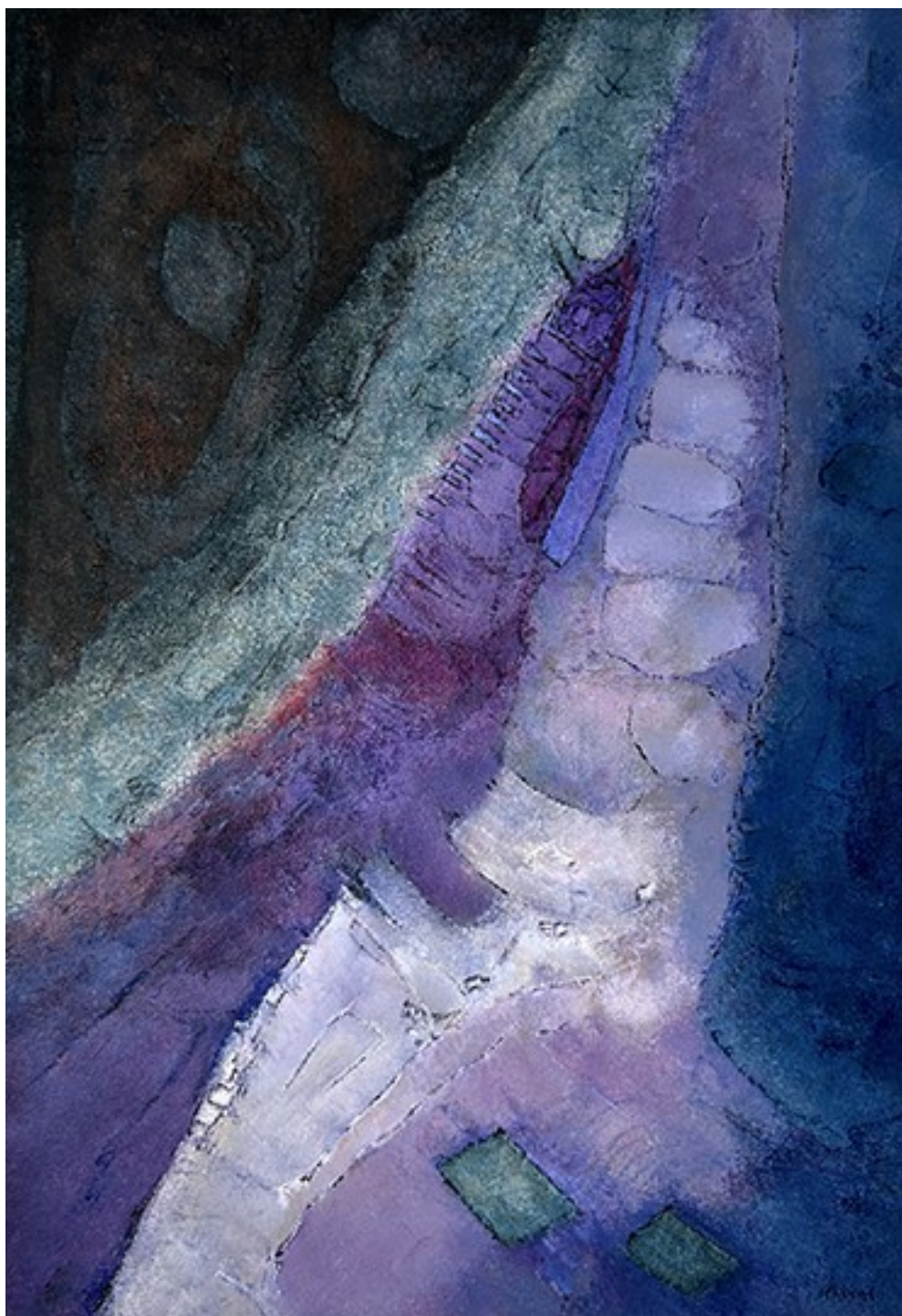
24. Αμπελώνας κοντά στη θάλασσα , 2023. Ακρυλικό σε καμβά, 83 × 58 εκ.