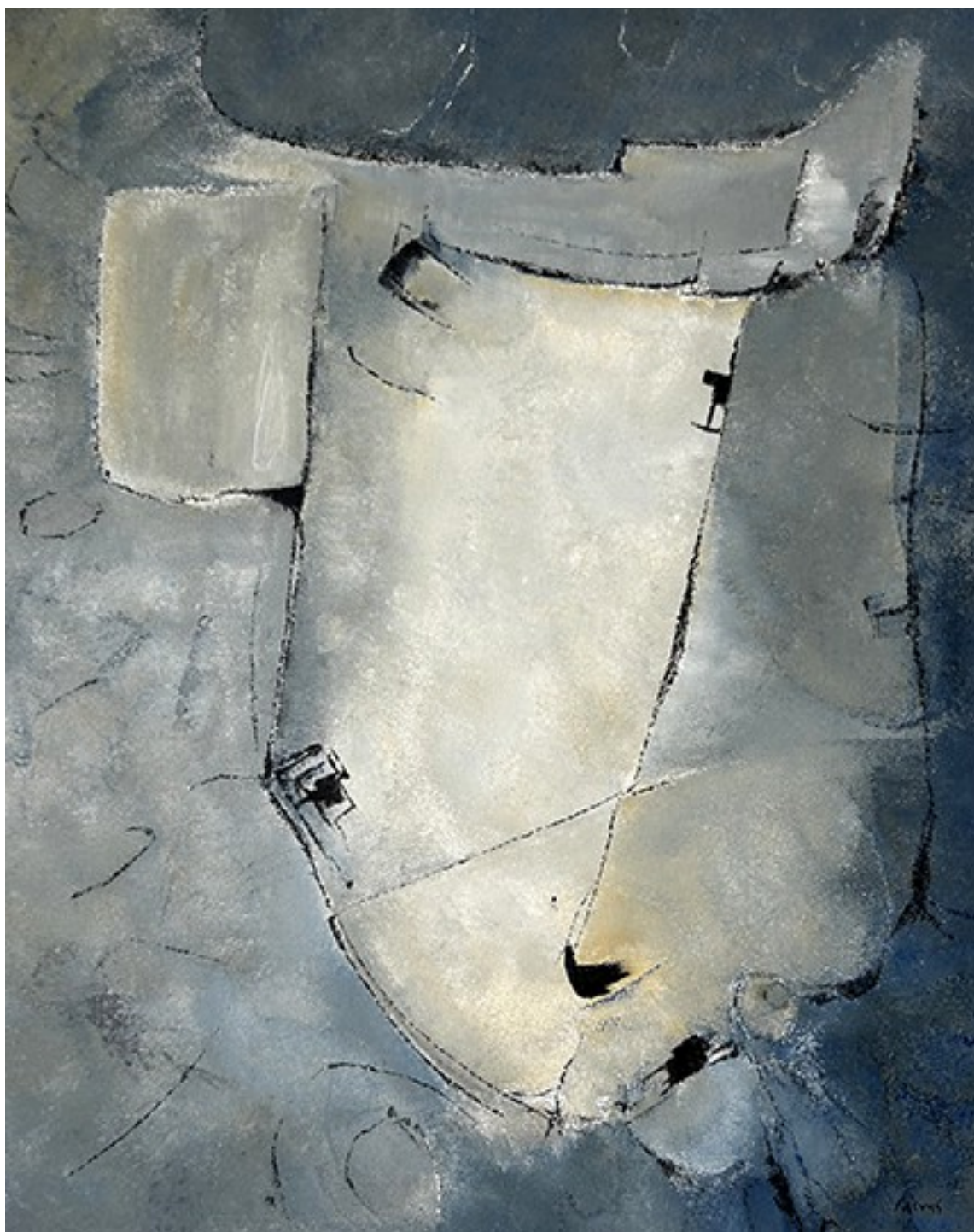
13. Πρώτη ύλη , 2022. Ακρυλικό σε καμβά, 83 × 66 εκ.