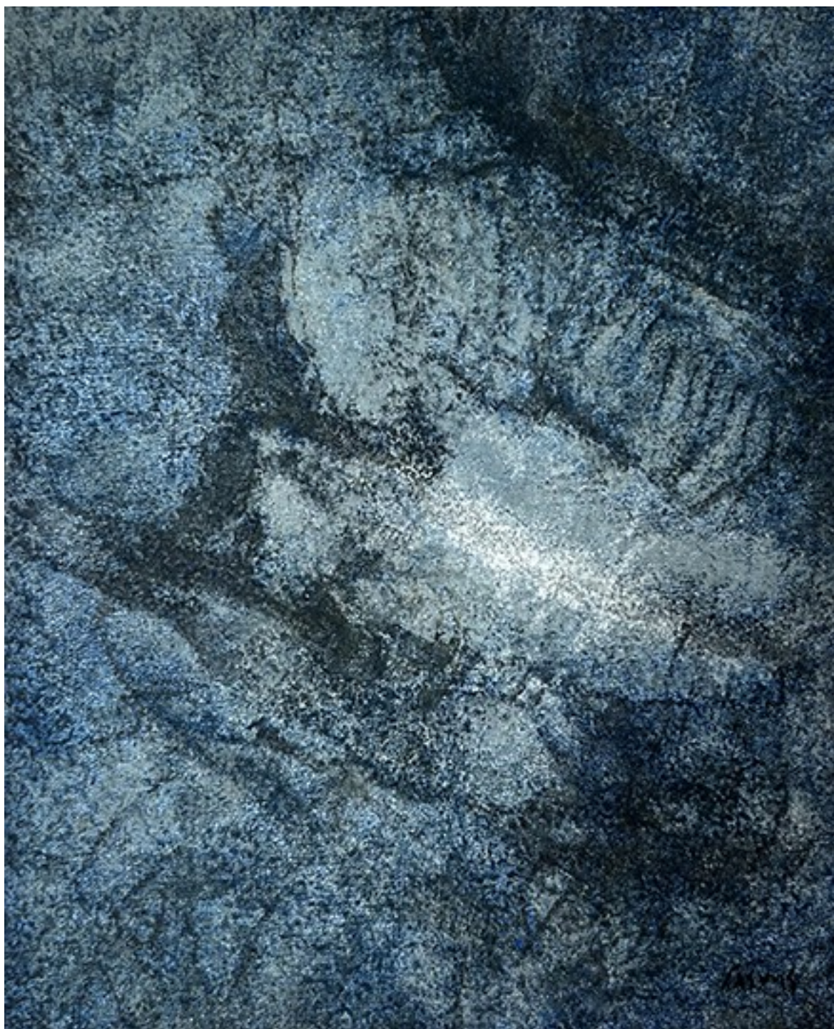
5. Απολίθωμα II , 2020. Ακρυλικό σε καμβά, 34 × 28 εκ.