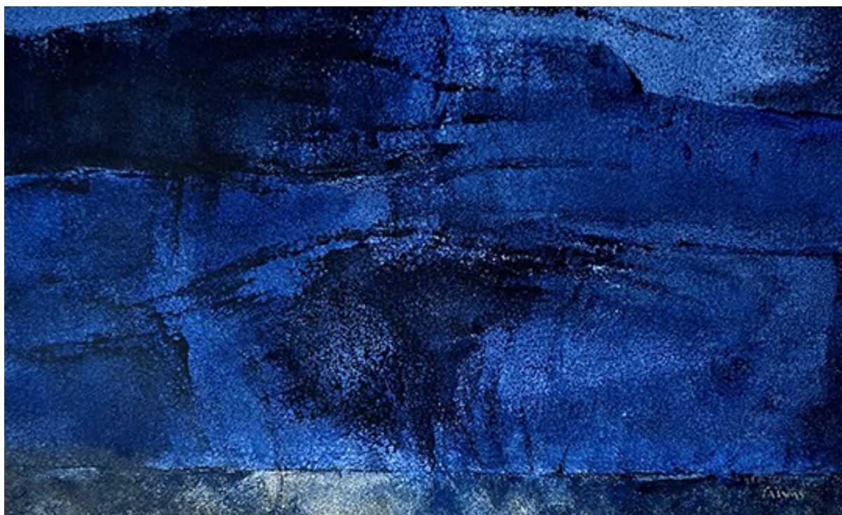
11. Νυχτερινό I , 2021. Ακρυλικό σε καμβά, 43 × 70 εκ.