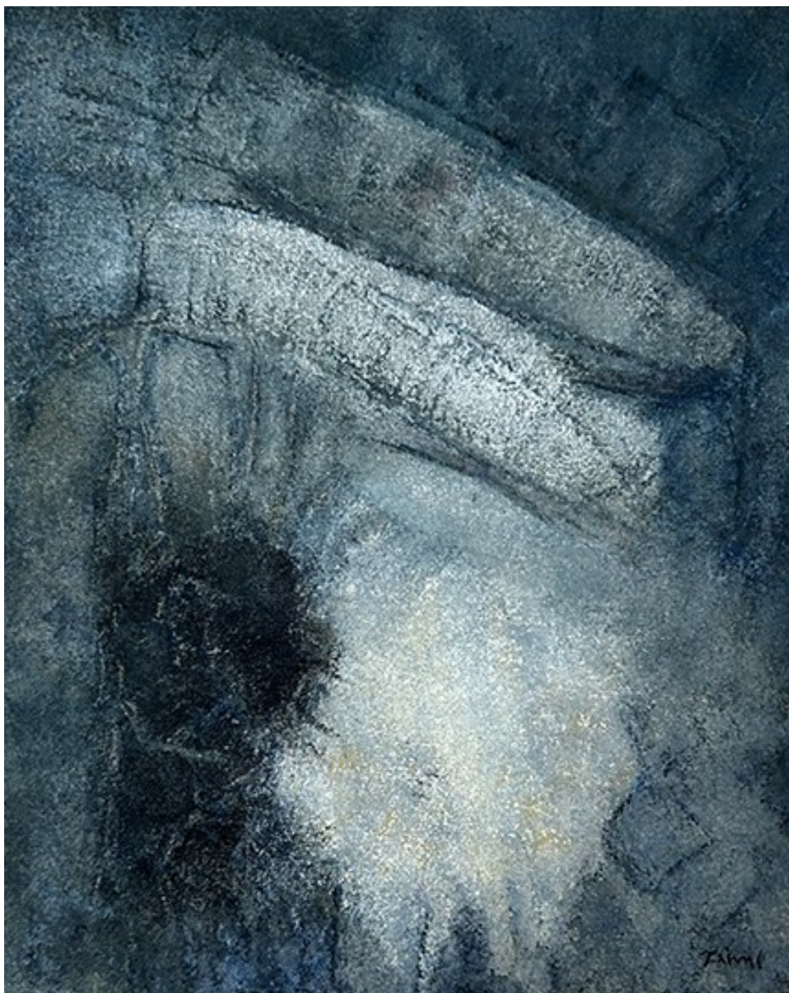
21. Αποτυπώματα , 2023. Ακρυλικό σε καμβά, 46 × 37 εκ.