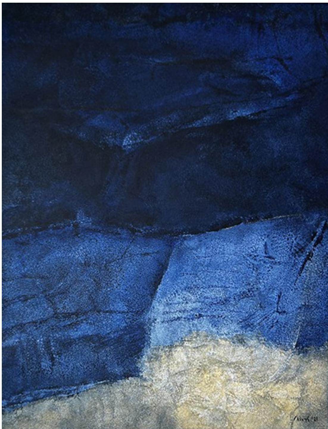
10. Νυχτερινή σιωπή , 2021. Ακρυλικό σε καμβά, 90 × 70 εκ.