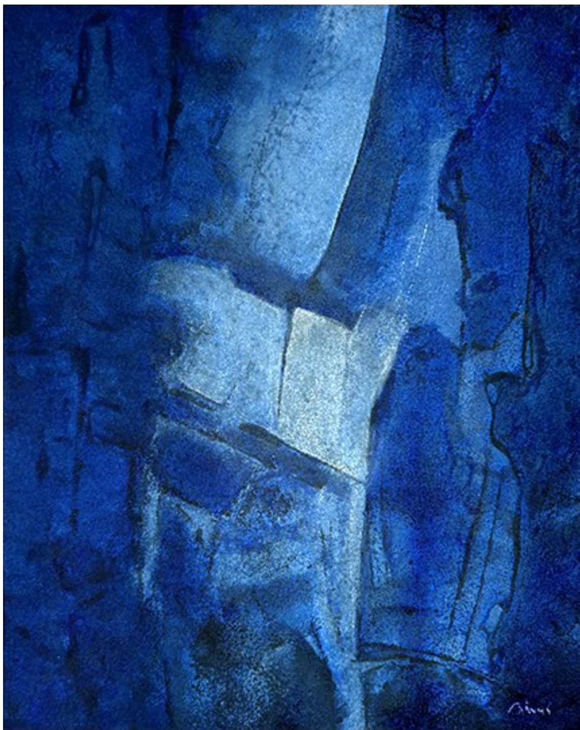
7. Βυθός II , 2021. Ακρυλικό σε καμβά, 50 × 40 εκ.