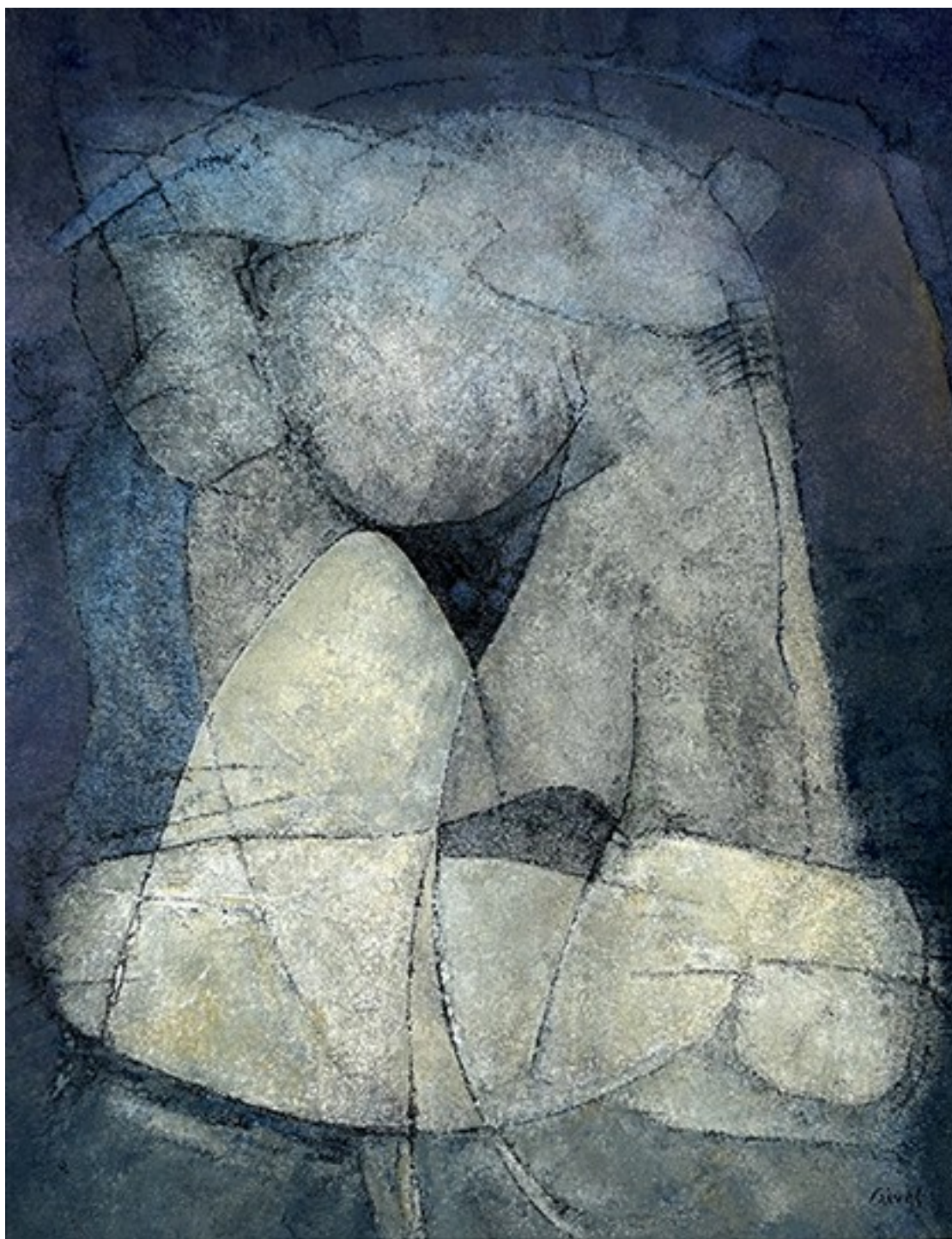
20. Στην παραλία , 2023. Ακρυλικό σε καμβά, 77 × 61 εκ.