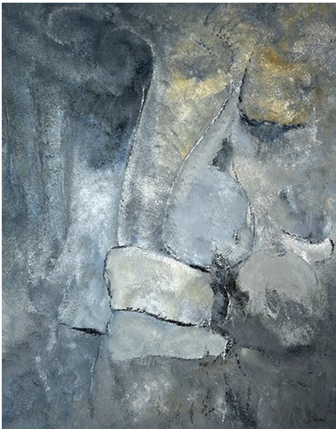
16. Αγκάλη II , 2022. Ακρυλικό σε καμβά, 83 × 66 εκ.