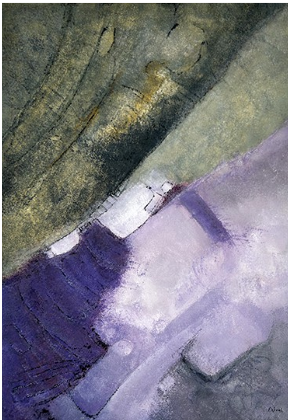
25. Κλήματα δίπλα σε αγρούς 2023. Ακρυλικό σε καμβά, 83 × 58 εκ.