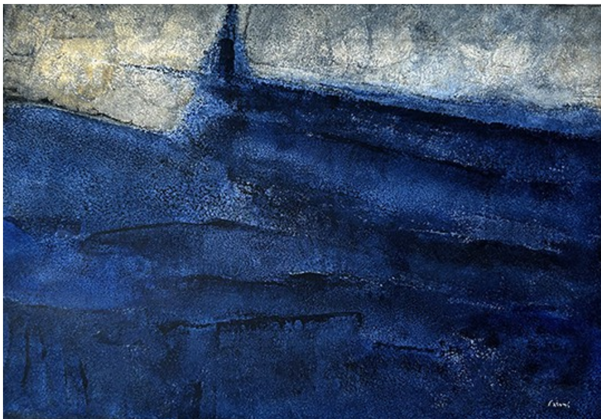
12. Νυχτερινό II , 2021. Ακρυλικό σε καμβά, 62 × 89 εκ.