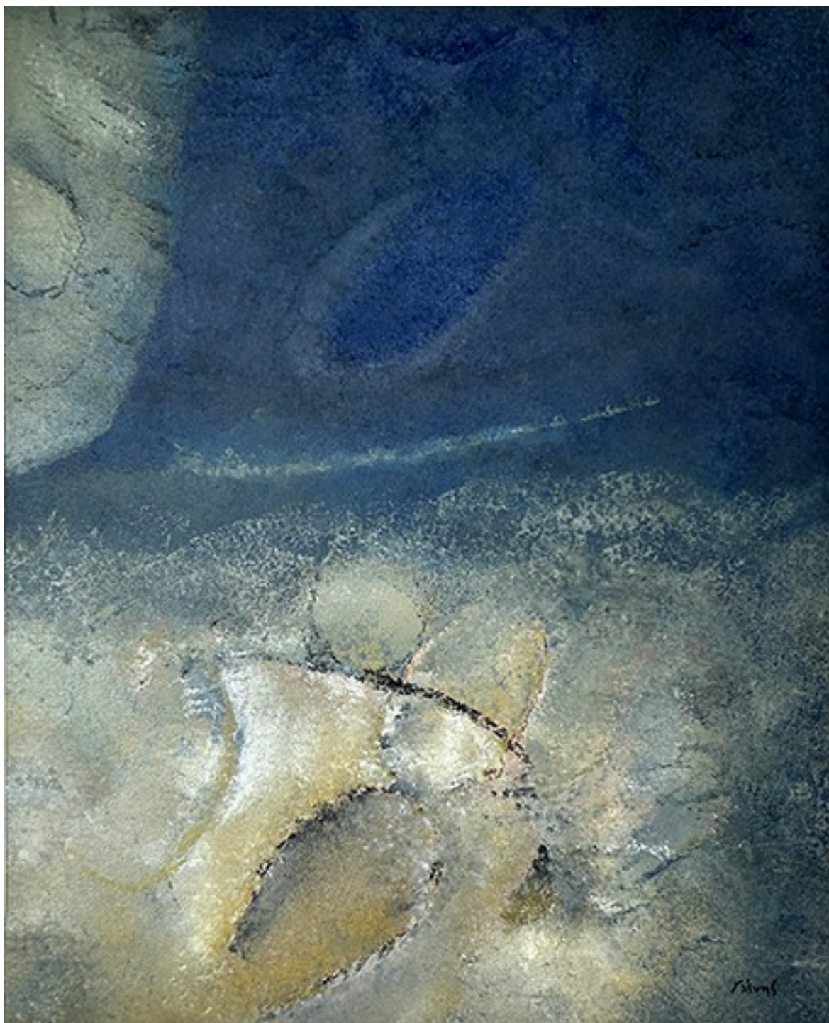
22. Κάτω από τη θάλασσα , 2023. Ακρυλικό σε καμβά, 56 × 46 εκ.