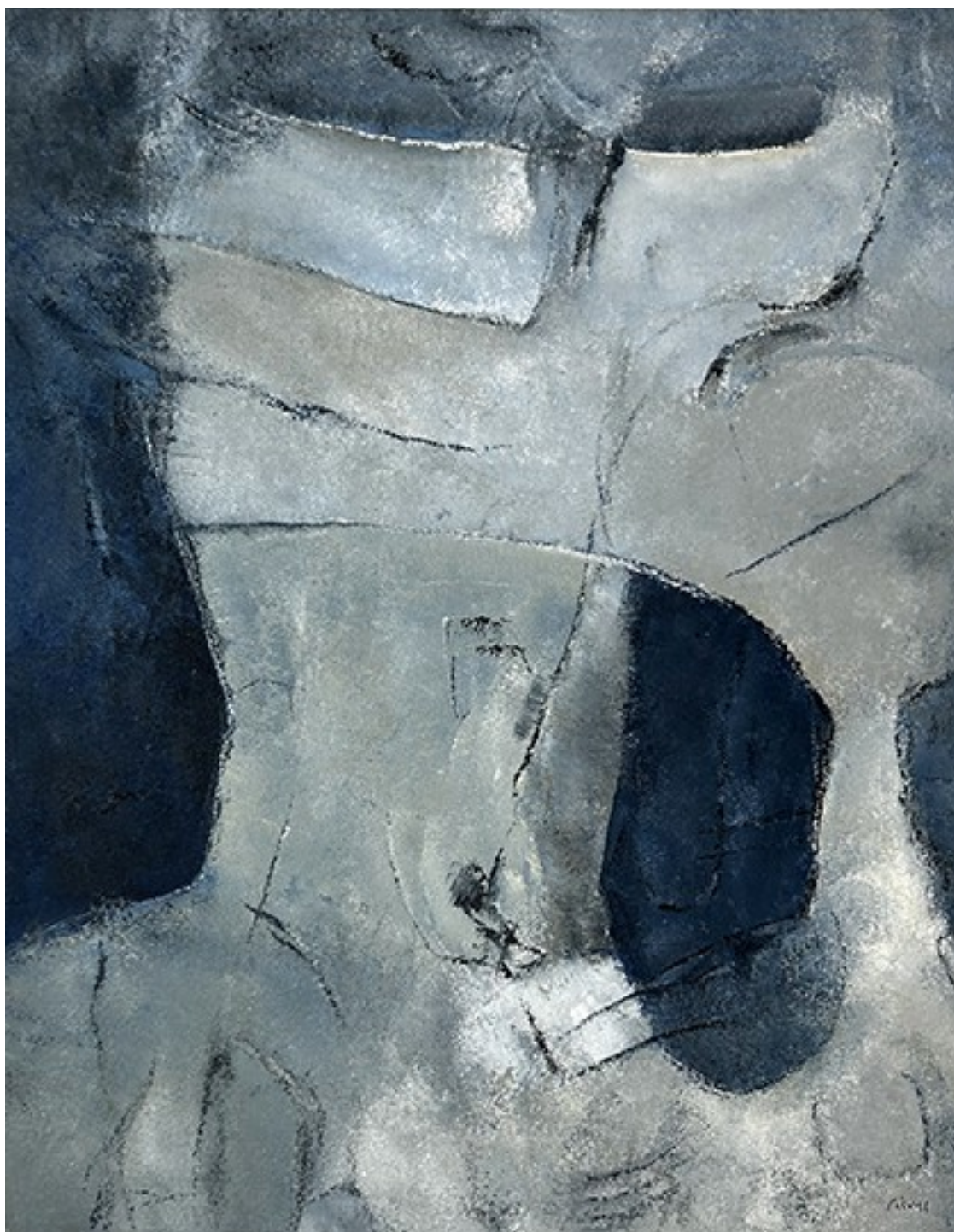
15. Αγκάλη I , 2022. Ακρυλικό σε καμβά, 83 × 66 εκ.