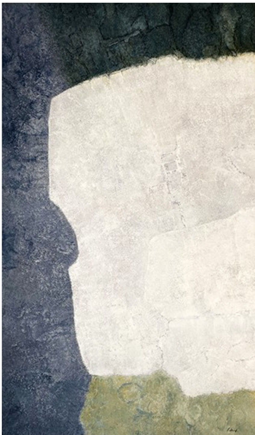
1. Εἰς μνήμην I , 2019. Ακρυλικό σε καμβά, 139 × 83 εκ.