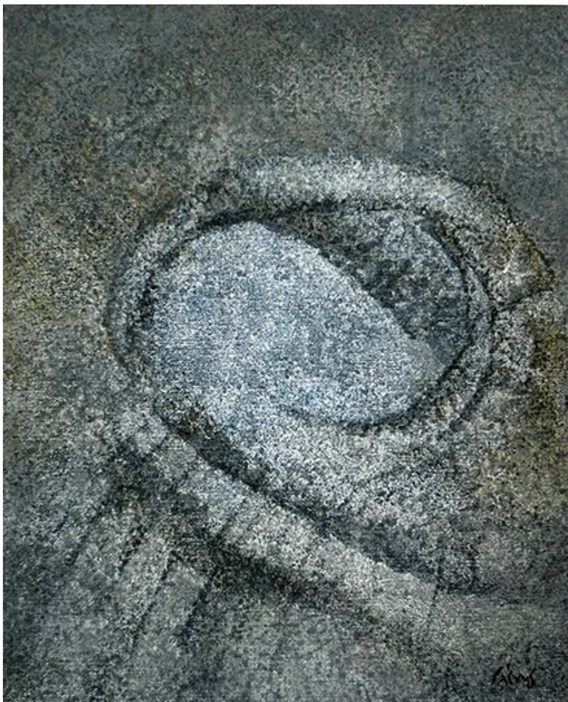
4. Απολίθωμα Ι , 2020. Ακρυλικό σε καμβά, 34 × 28 εκ.