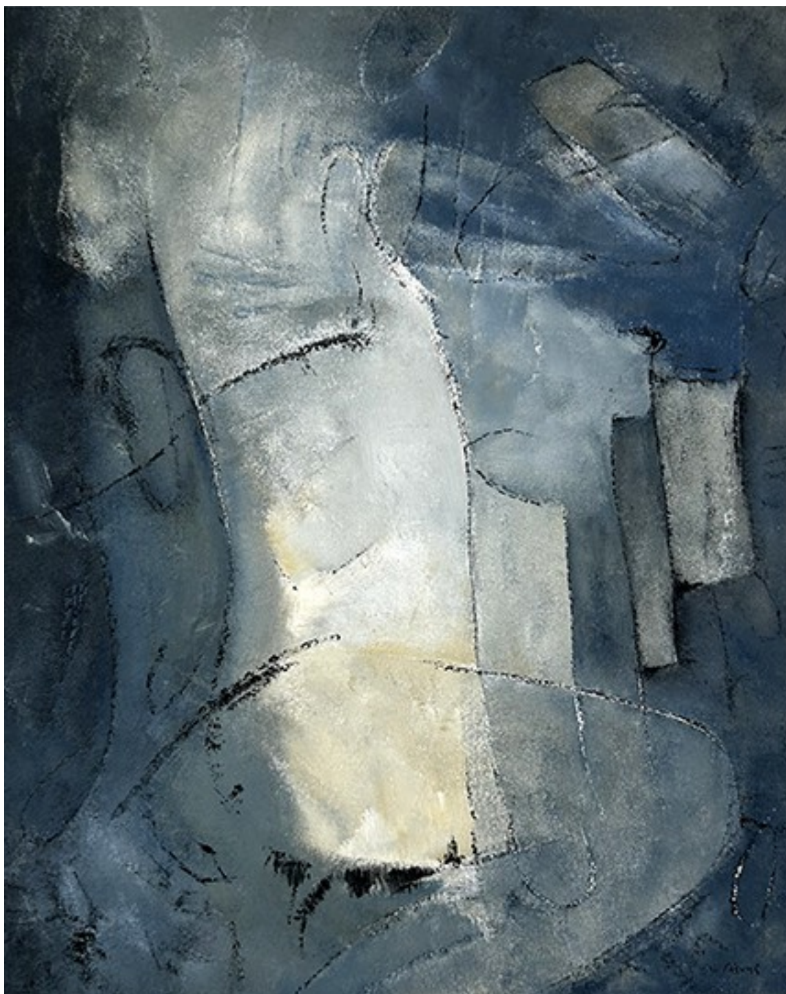
14. Επαφή , 2022. Ακρυλικό σε καμβά, 83 × 66 εκ.