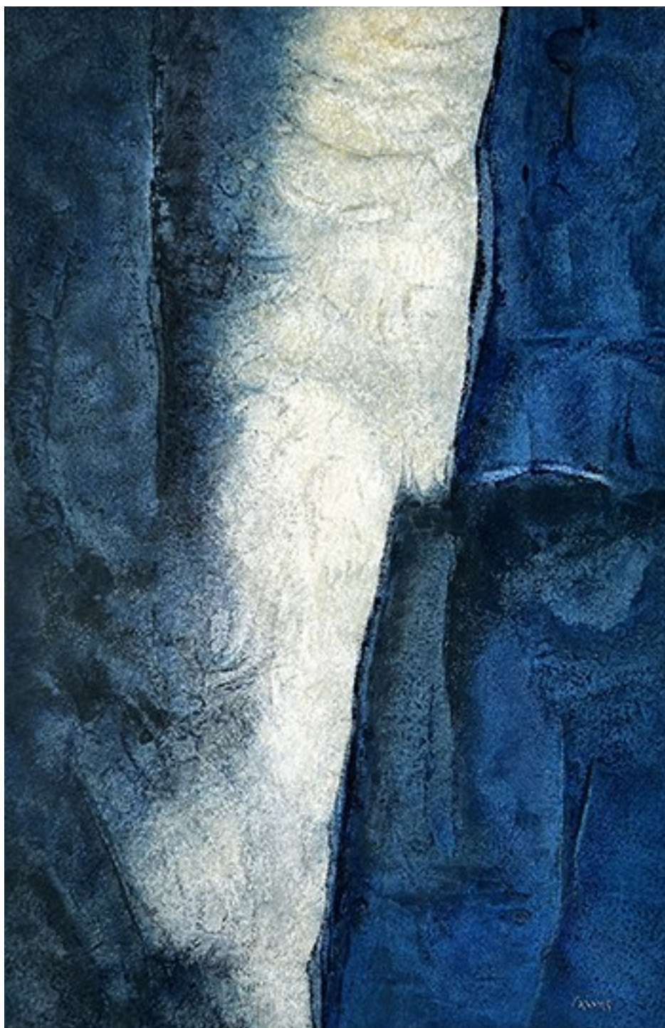
8. Κατάδυση , 2021. Ακρυλικό σε καμβά, 77 × 51 εκ.