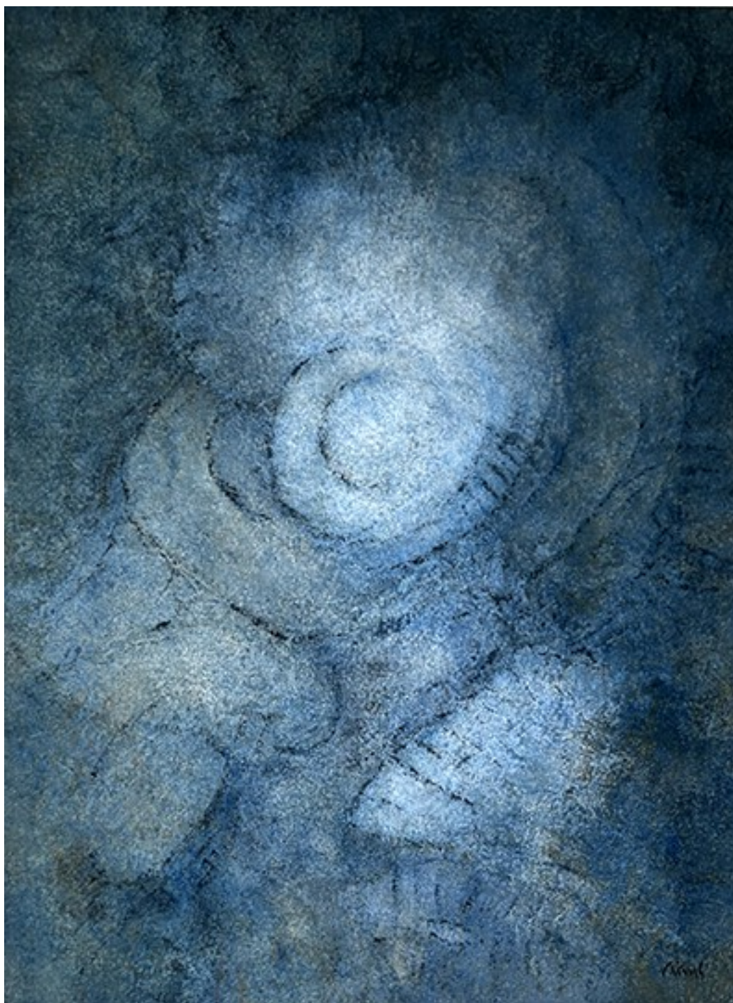
3. Απολίθωμα , 2020. Ακρυλικό σε καμβά, 60 × 45 εκ.