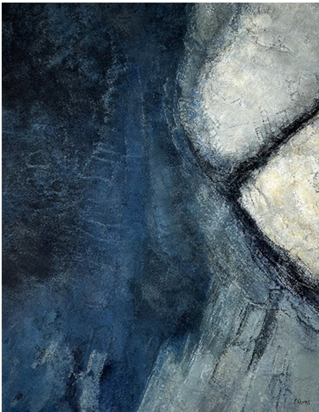
19. Ο Ήχος του Νερού , 2022. Ακρυλικό σε καμβά, 77 × 61 εκ.