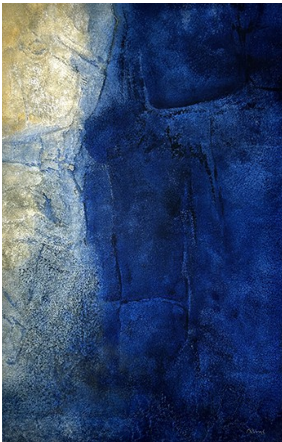
9. Δυτική ακτή , 2021. Ακρυλικό σε καμβά, 95 × 62 εκ.