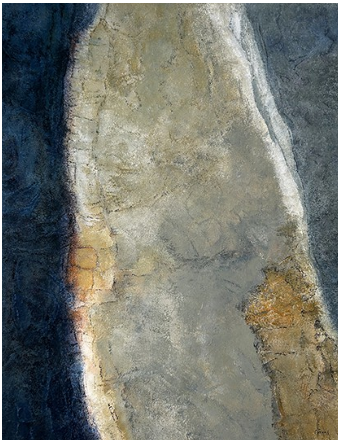
18. Αβάλι , 2022. Ακρυλικό σε καμβά, 83 × 64 εκ.